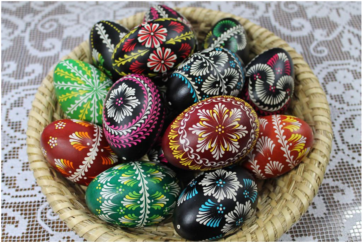
Rysunek 2.

Prezentowane pisanki wykonane są techniką batikową na wydmuszce jaja kurzego i gęsiego . Metoda polega na nanoszeniu rozgrzanego wosku na skorupkę jajka za pomocą szpilki. Pokryte woskiem jajko jest barwione, następnie osuszone i ponownie nakłada się wosk. Czynność ta jest powtarzana na każdym zastosowanym kolorze. Na końcu usuwamy wosk i odkrywamy wzory.