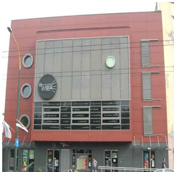
SALA WIDOWISKOWO- MUZYCZNA „ MUZA”