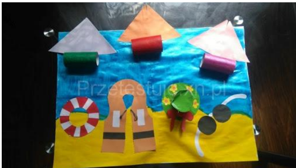
Rysunek 1. http://swiatwedluglilii.pl/dla-dziecka/bezpieczne-wakacje-morze/

Jeśli wyprawka pozostała w przedszkolu poniżej inspiracje do wykonania pracy: