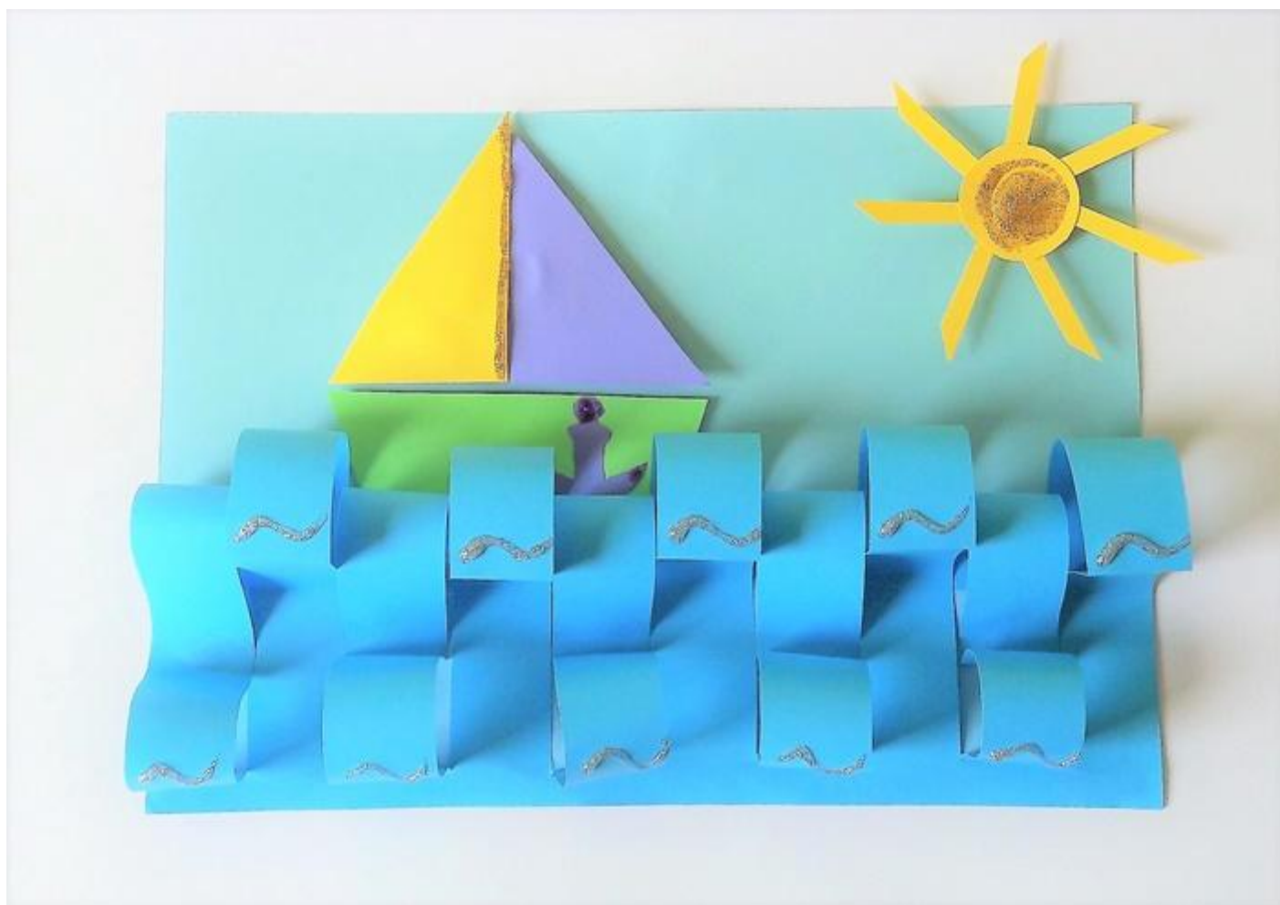
Rysunek 2. https://www.szkolneinspiracje.pl/wakacyjne-wspomnienia/