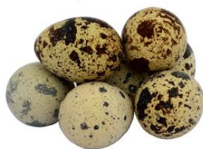
Rysunek 2 http://przepiorki.eu/index.php/informacje/wlasciwosci-jaj-przepiorkczych/