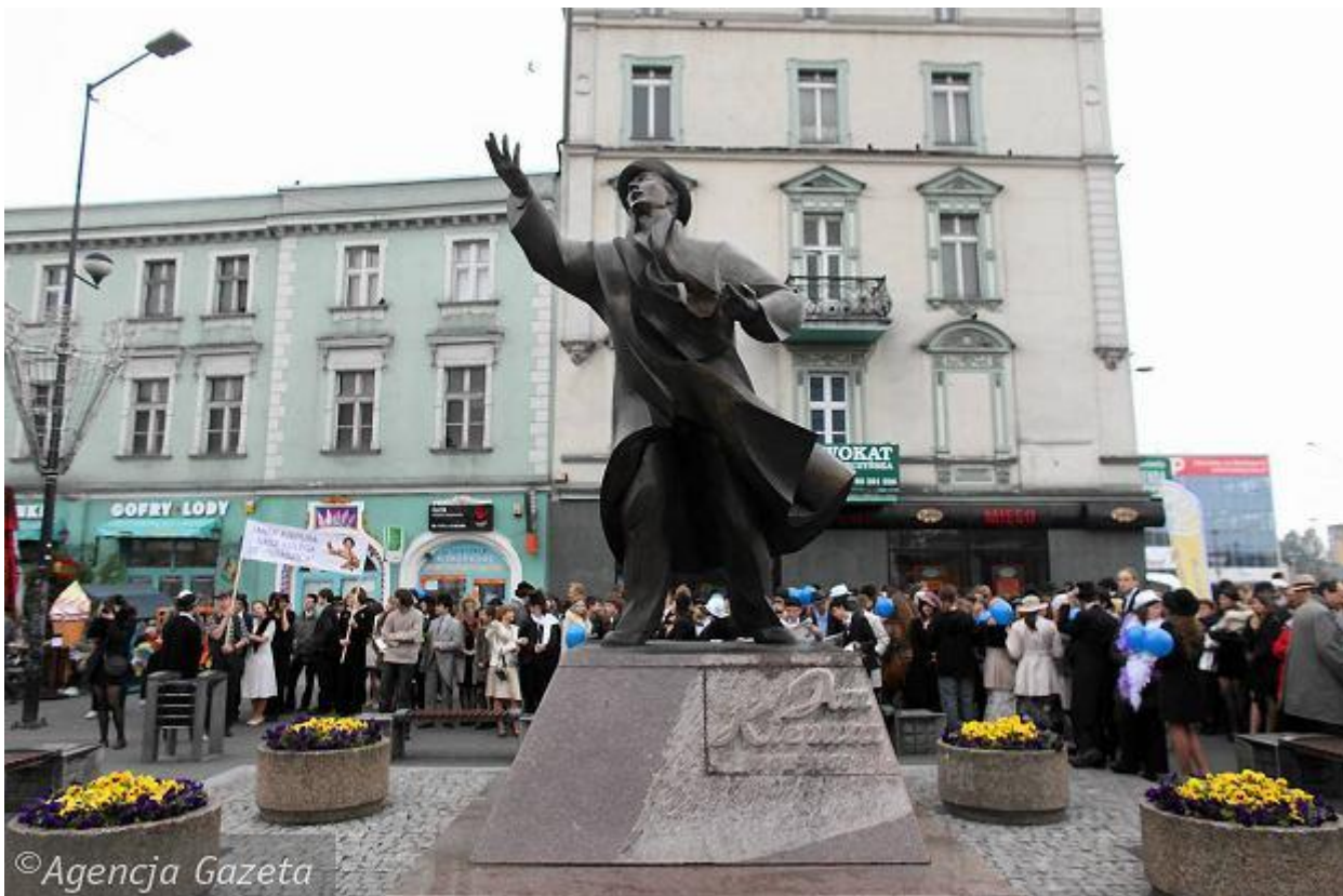
Rysunek 4. Krajobraz miejski.