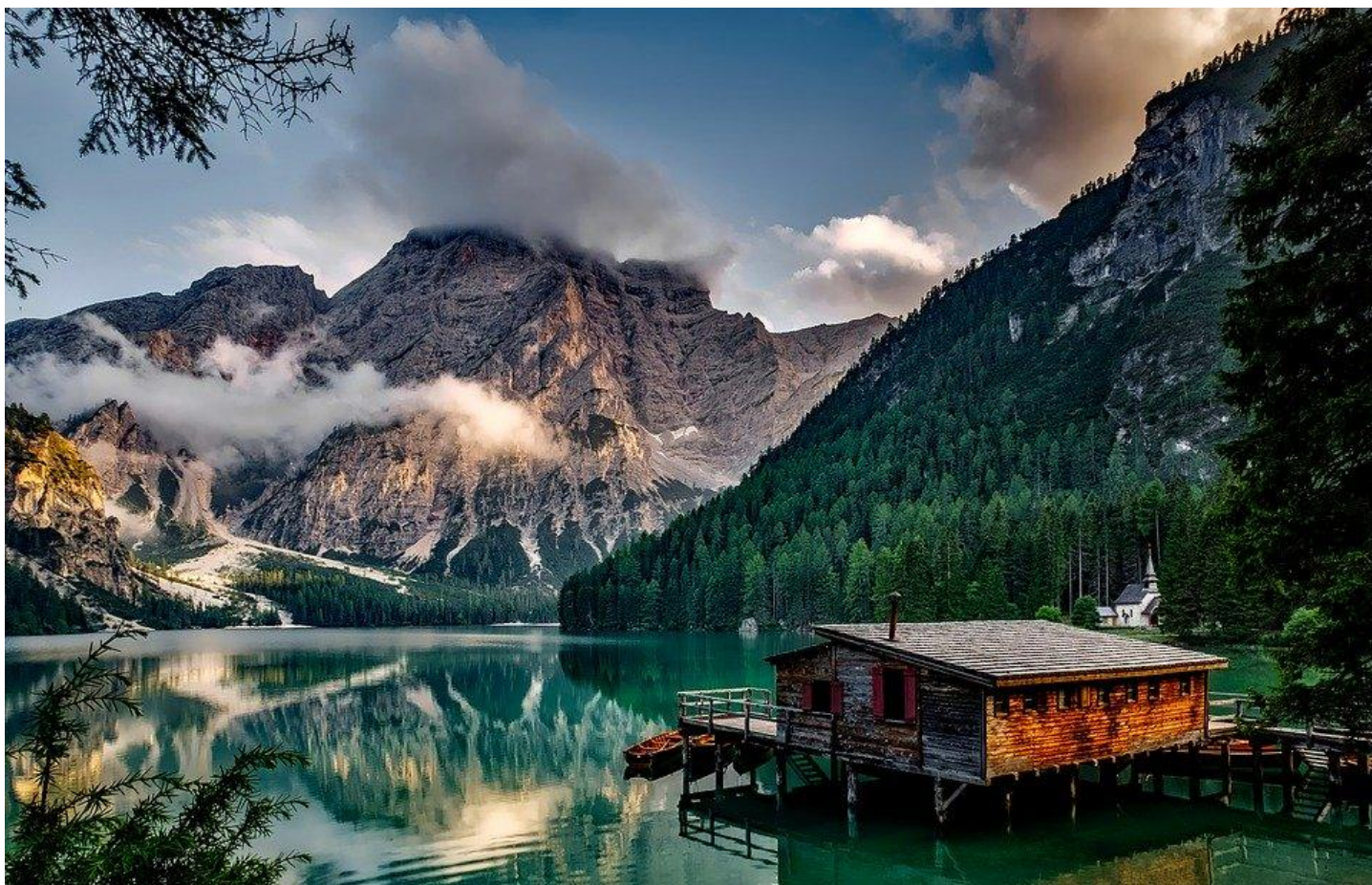
Rysunek 2. Krajobraz górski