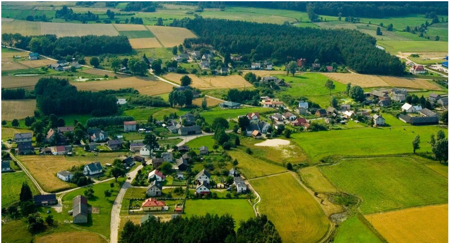
Rysunek 5. Krajobraz wiejski. https://www.skarszewy.pl/start/aktualnosci/konkurs-piekna-wies-etap-gminny

– Wykonanie pracy plastycznej na temat Wakacyjny pociąg