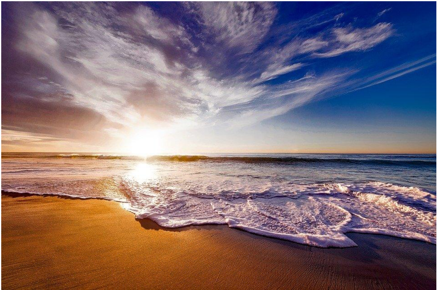
Rysunek 3. Krajobraz morski