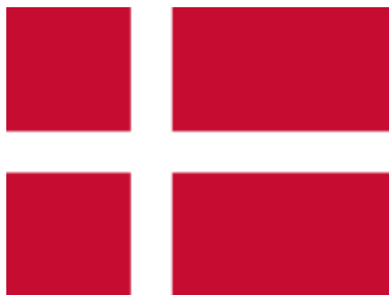
Rysunek 1. Flaga Danii

Kiedy rodzic pokazuje flagę Polski, dziecko naśladuje jazdę na rowerze: powoli po terenach górzystych, szybciej po terenach nizinnych. Gdy rodzic zmienia flagę na duńską, dziecko przesiada się do samolotu.