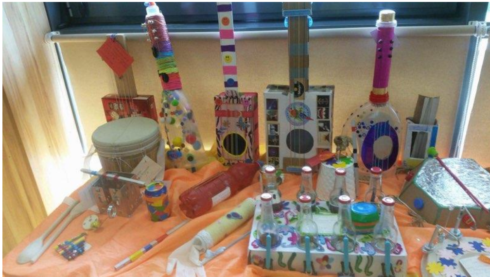
Rysunek 1. https://sp39kielce.pl/swietlica/v-miedzyswietlicowy-konkurs-plastyczno-techniczny-o-tematyce-ekologicznej-wykorzystywac-surowce-wtorne-eko-instrument-muzyczny/