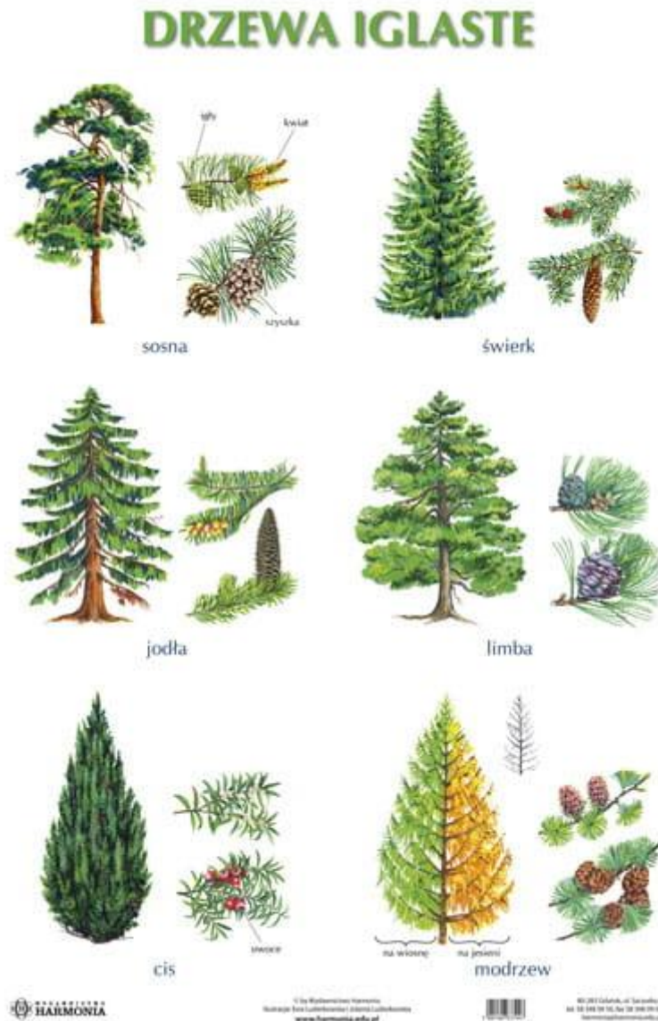
Rysunek 1. https://sites.google.com/site/drzewa1305/home/drzewa-iglaste