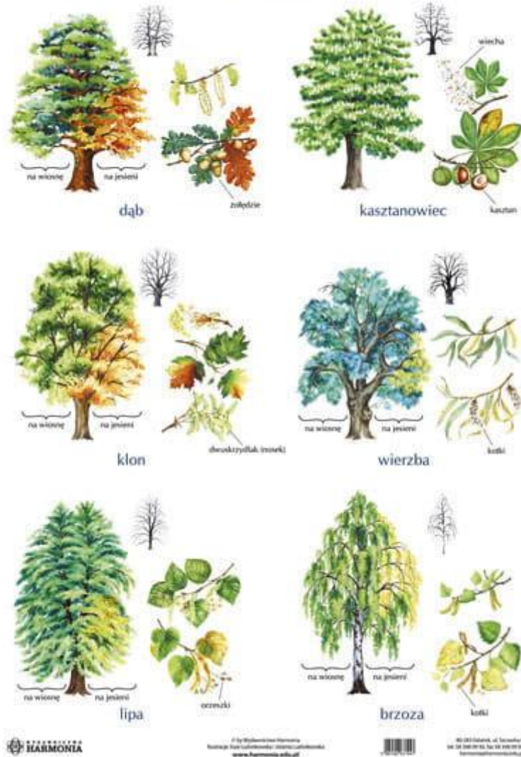
Rysunek 2. https://sites.google.com/site/drzewa1305/home/drzewa-liściaste