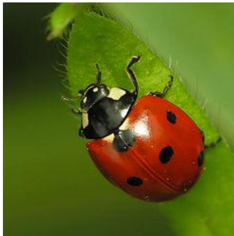
Rysunek 1.

Rodzic pokazuje na zdjęciu części ciała biedronki, nazywa je (pancerz, pod nim skrzydła, głowa, oczy, aparat gębowy, nogi, czułki). Biedronki należą do rodziny chrząszczy. Przechodzą przez stadia przeobrażenia (jak np. motyl). W Polsce najczęściej spotykanymi gatunkami biedronek są dwukropki i siedmiokropki, co oznacza, że liczba kropek nie wskazuje na wiek, tylko na gatunek . Biedronki są pożyteczne, bo zjadają mszyce – szkodniki roślin.