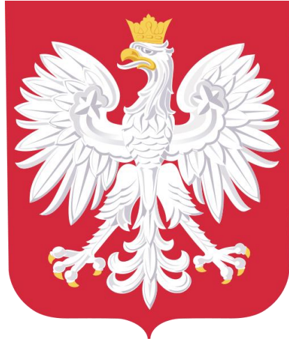
Rysunek 1. https://www.gov.pl/web/kultura/symbole-narodowe